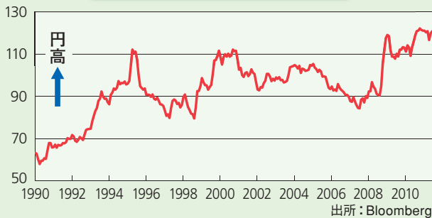
日本円名目実効為替レート

名目為替レートとは多数の国の通貨が取引される外国為替市場における通貨の相対的な実力を測る指標です。対象となるすべての通貨との2通貨間為替レートを、貿易額などに応じてウエート付けして算出します。名目実効為替レートは物価変動の影響を考慮していません。